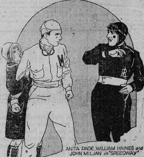
ANITA PAGE, WILLIAM HAINES and JOHN MILJIAN in "SPEEDWAY"

Este domingo es el que le brinda la empresa del Teatro Variedades con el sensacional estreno de "El Ferroviario" superproducción sonora y musicalizada