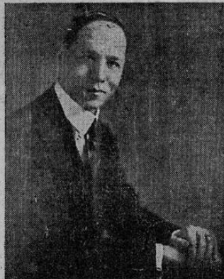
Dr. ENRIQUE OLAYA HERRERA quien asume la Presidencia de Colombia

Ante el Congreso pleno tomó hoy posesión de la Presidencia de la República de Colombia, el lustre estadista doctor Enrique Olaya Herrera.