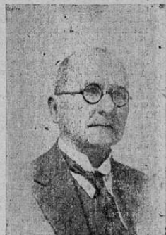
Dr. ABADIA MENDEZ

En esta fecha clásica para Colombia, A B C rinde homenaje a los fundadores de su nacionalidad y saluda con respecto al President doctor Enrique Olaya Herrera.